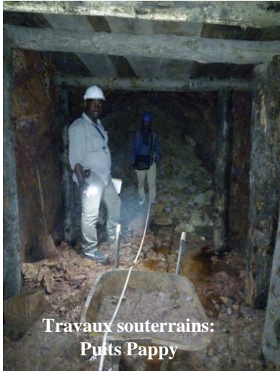
Travaux souterrains: Puits Pappy