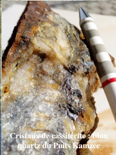
Cristaux de cassitérite : filon quartz du Puits Kamzee