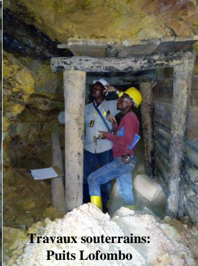
Travaux souterrains: Puits Lofombo